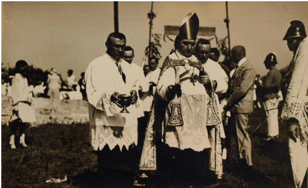
A sashalmi katolikus templom alapkövetétele 1927. 09.