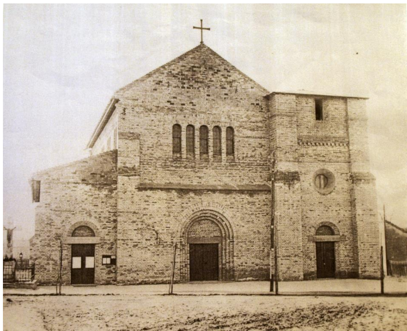
04d A torony nélküli templom 1931 után.