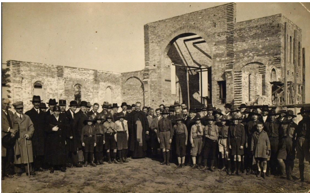
A templom építése