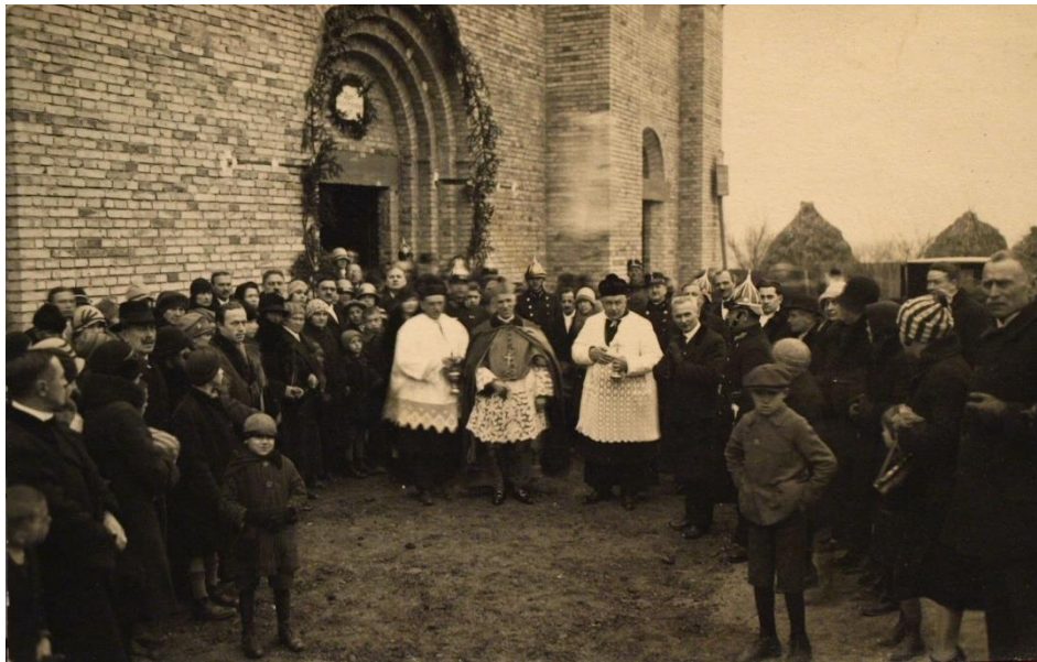
A templom felszentelése 1931. április 19.