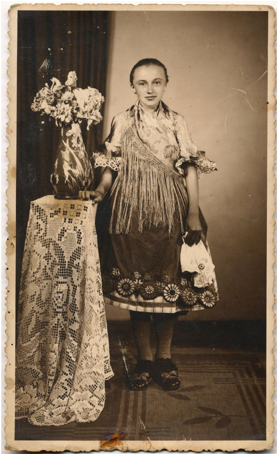
Leány cinkotai népviseletben