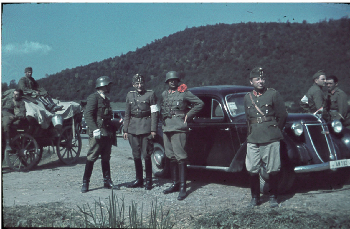
Két 1944-ben, Erdélyben készült színes dia digitális változata