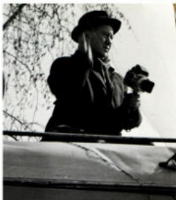
Felvételei az ötvenes években, a Magyar Mezőgazdaság címlapjain