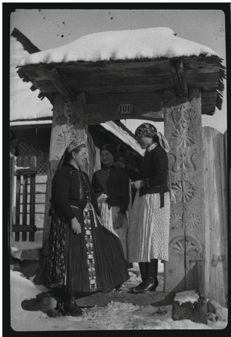
1944-ben készült néprajzi felvételei