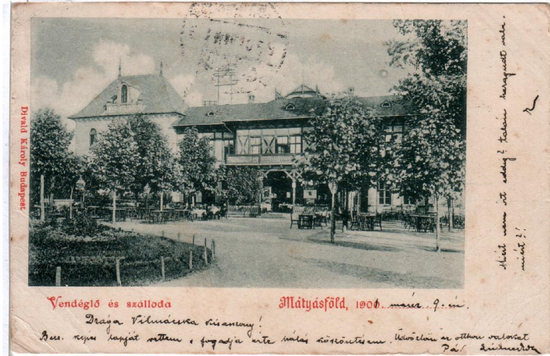
A mátyásföldi Nagyvendéglő két képeslapján az épület középső része az eredeti vendéglővel