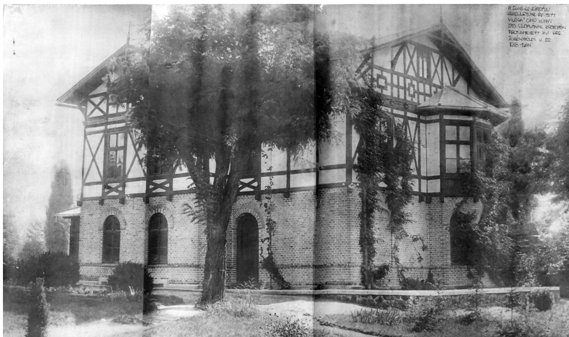
A Beniczky Vadászlak 1918-as fényképe Az Árpád utcában. Mai neve Bökényföldi út.

Íme, egy feltételezés. A nagyvendéglőt Beniczky Gábor Cinkota földbirtokosa építtette 1888-ban, a Mátyásfüldi Nyaralótulajdonosok Egyesületével szerződve. Ekkor már állt a mai Bökényföldi utcai Beniczky vadászlak, aminek 1908-as képén feltűnő az épület szerkezetének hasonlósága mind az eredeti, favázas nagyvendéglővel, mind az Ünnepélyek csarnoka épületével.