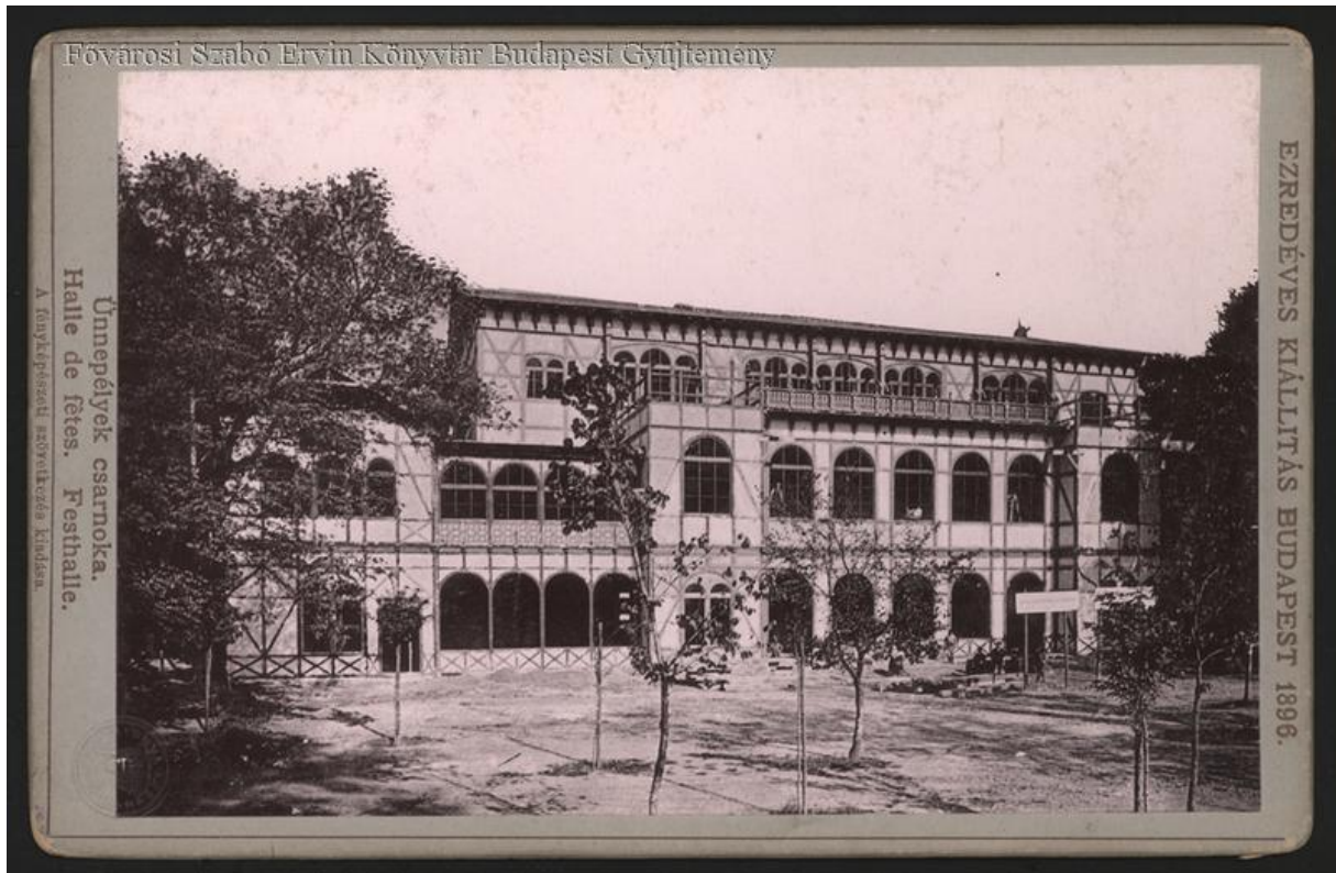
A városligeti Ünnepélyek Csarnoka két korabeli fényképe.