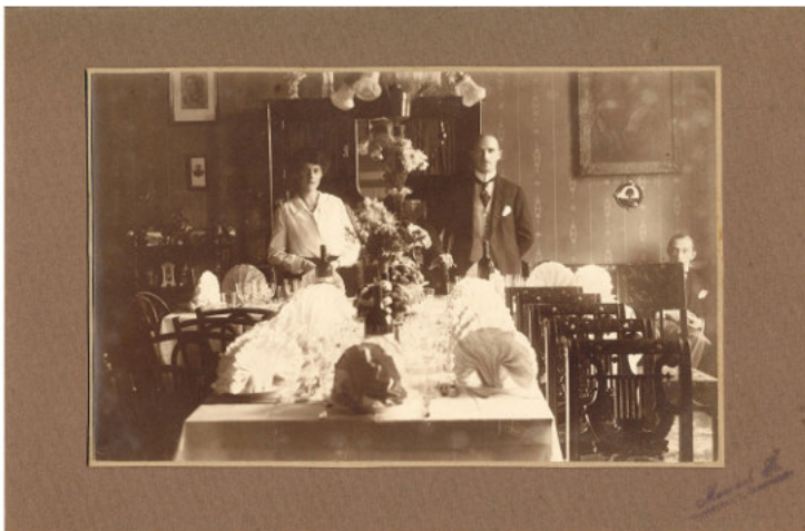
A Ferenczi család képei